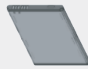
표준형 2900mAh LI-ION 배터리 BT000592A01