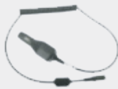
차량용 파워 어댑터 PMPN4169