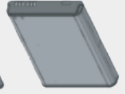
대용량 5800mAh LI-ION 배터리* BT000593A01